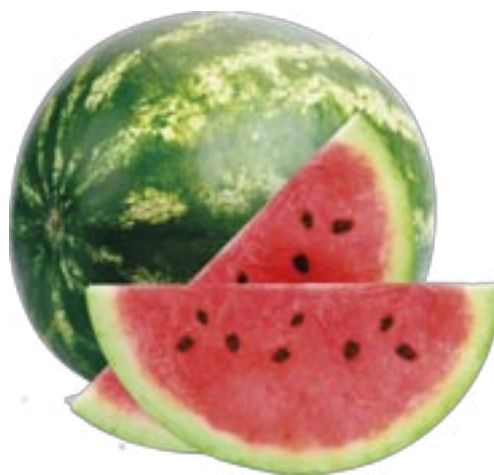
Angurie Baby provenienza nazionale al kg