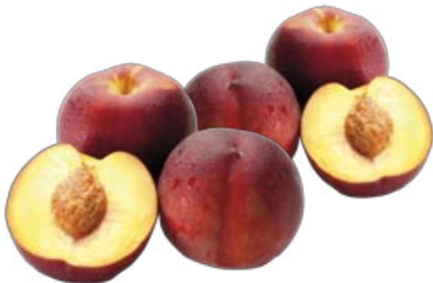
Pesche Pasta Gialla provenienza nazionale al kg