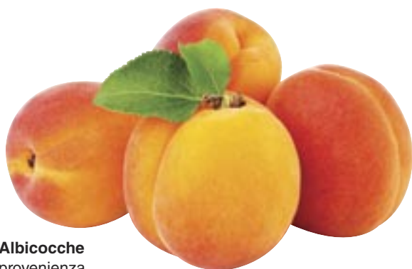
Albicocche provenienza nazionale al kg