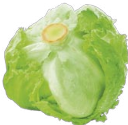
Insalata Iceberg provenienza estero al kg