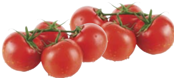
Pomodoro Grappolo Ramato provenienza estero al kg