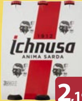
Birra ICHNUSA d 33 x 3