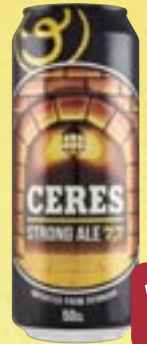
Birra Strong Ale CERES cl 50