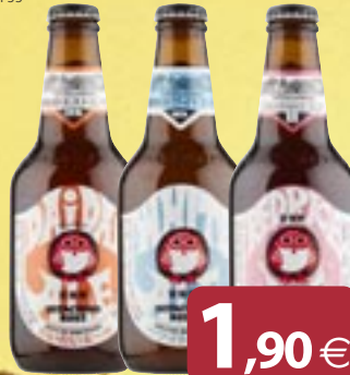
Birra Dai Dai Ipa, White, Red HITACHINO cl 33