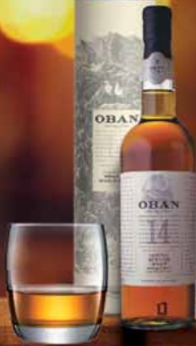
OBAN 14 yo

Un whisky speziato e morbido, con note di frutta esotica. Ideale in abbinamento con la bresaola, saporita e gustosa. Un abbinamento piacevole e intrigante.