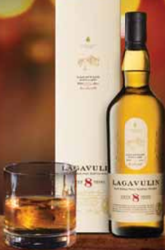
LAGAVULIN 8 yo

Whisky dal gusto affumicato, sapido e deciso. Ideale in abbinamento con baccalà alla vicentina.