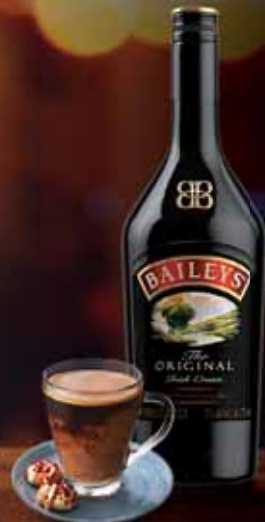
BAILEYS ORIGINAL & CAFFÈ

Proponi Baileys Original al caffè da gustare ancora caldo.