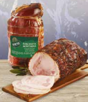
Porchetta Montagna al kg