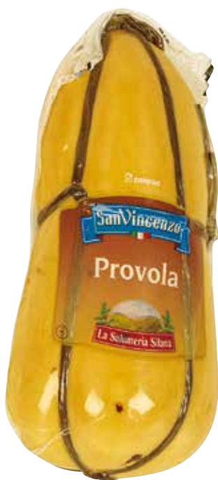
Provola Affumicata SAN VINCENZO al kg