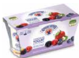
Yogurt Intero ai Frutti di Bosco STERZING-VIPITENO g 125 x 2