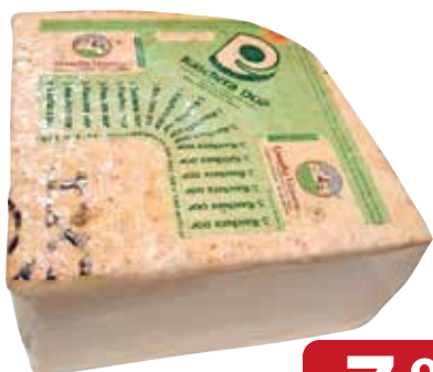
Raschera Dop QUAGLIA quarti - al kg