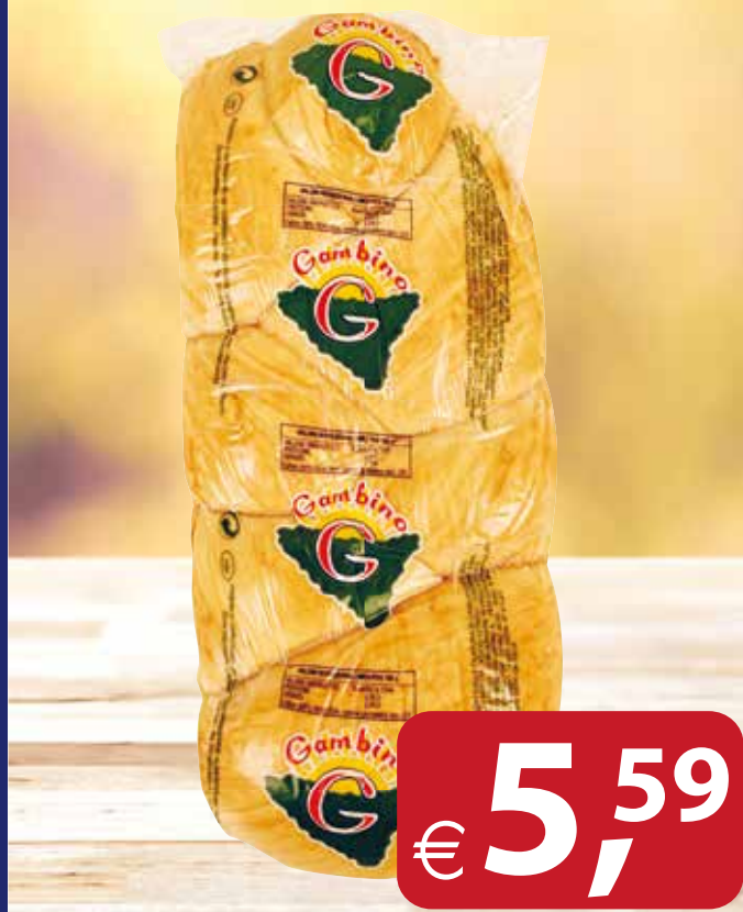
Treccione Affumicato GAMBINO al kg