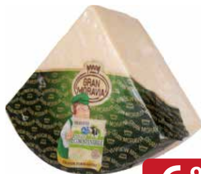
GRAN MORAVIA kg 4 ca. - al kg