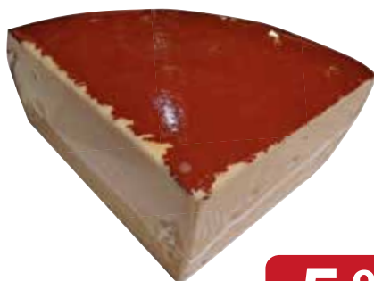
Fontal Tedesco BASSI quarti - al kg