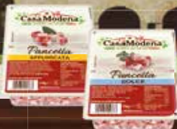
Pancetta Cubetti Casa Modena g 110