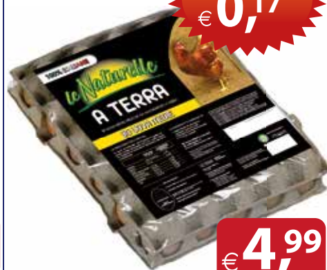
Ova M da Allevamento a terra LE NATURELLE 30 uova