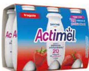
Actimel alla Fragola DANONE g 100 x 6