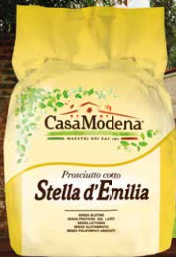
Prosciutto Cotto Stella d'Emilia al kg