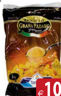
Grana Padano Dop Grattugiato ZARPELLON kg 1