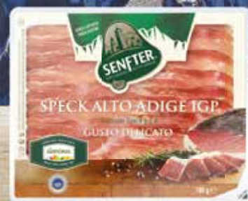
Speck Alto Adige IGP g 100