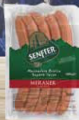
Wurstel Meraner kg 1