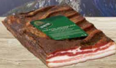
Pancetta Affumicata al kg