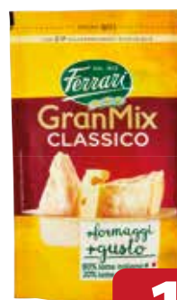
Formaggio Grattugiato GranMix Classico FERRARI g 100