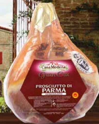
Prosciutto di Parma Gran Cru al kg